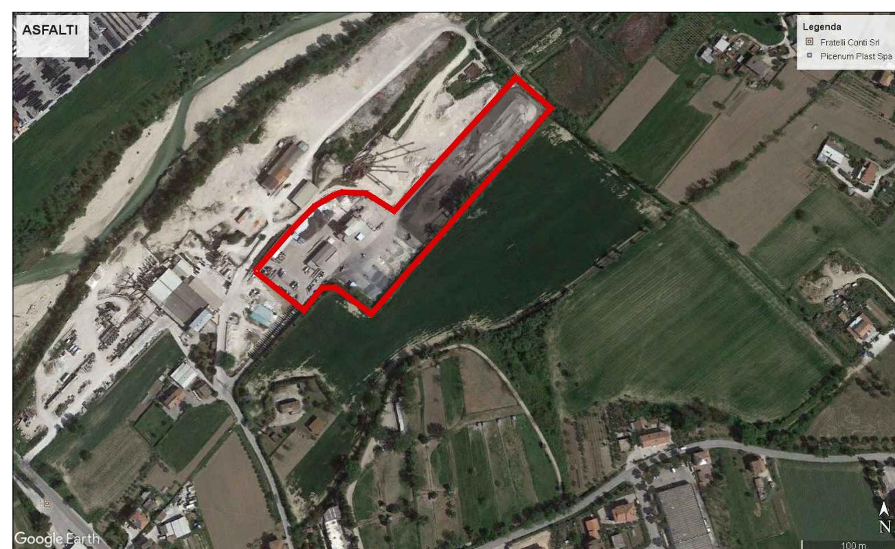
IMMAGINE ORTOFOTO - scala 1 : 5000 - rappresentazione estrapolata da google earth

PROGETTO SU MAPPA CATASTALE - scala 1 : 2 000 con individuazione dei punti di presa fotografica