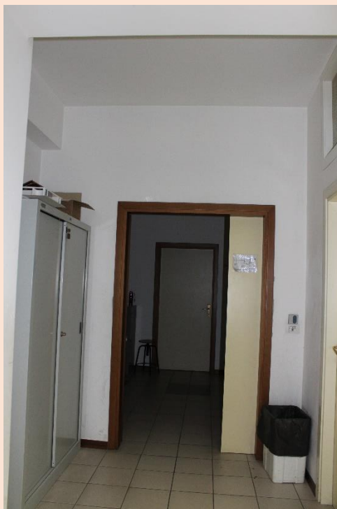
PIANO PRIMO – Uscita laboratorio di disegno geometrico.