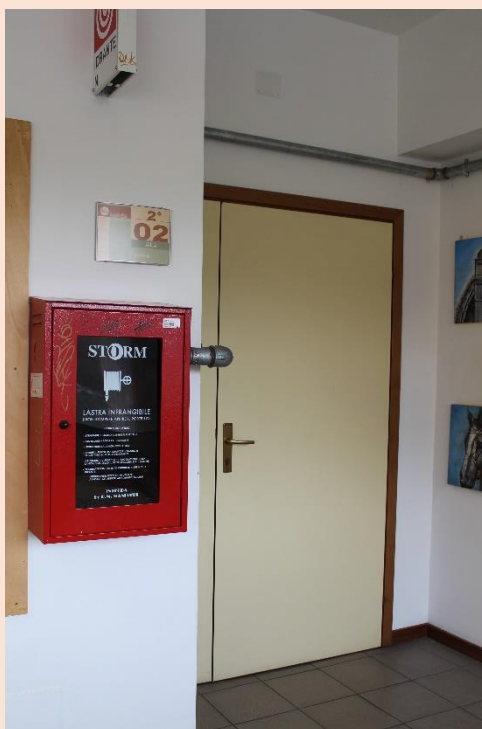
PIANO SECONDO – Uscita laboratorio figurativo.