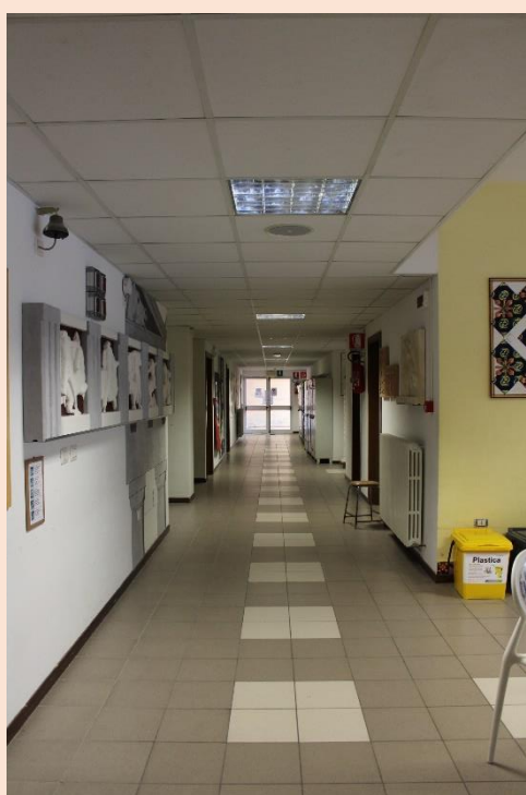
PIANO TERRA – Corridoio.