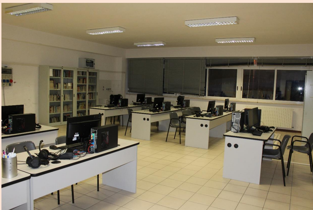
PIANO PRIMO – Laboratorio di industrial design.