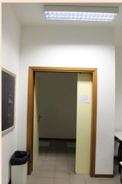
PIANO SECONDO – Uscita aula.