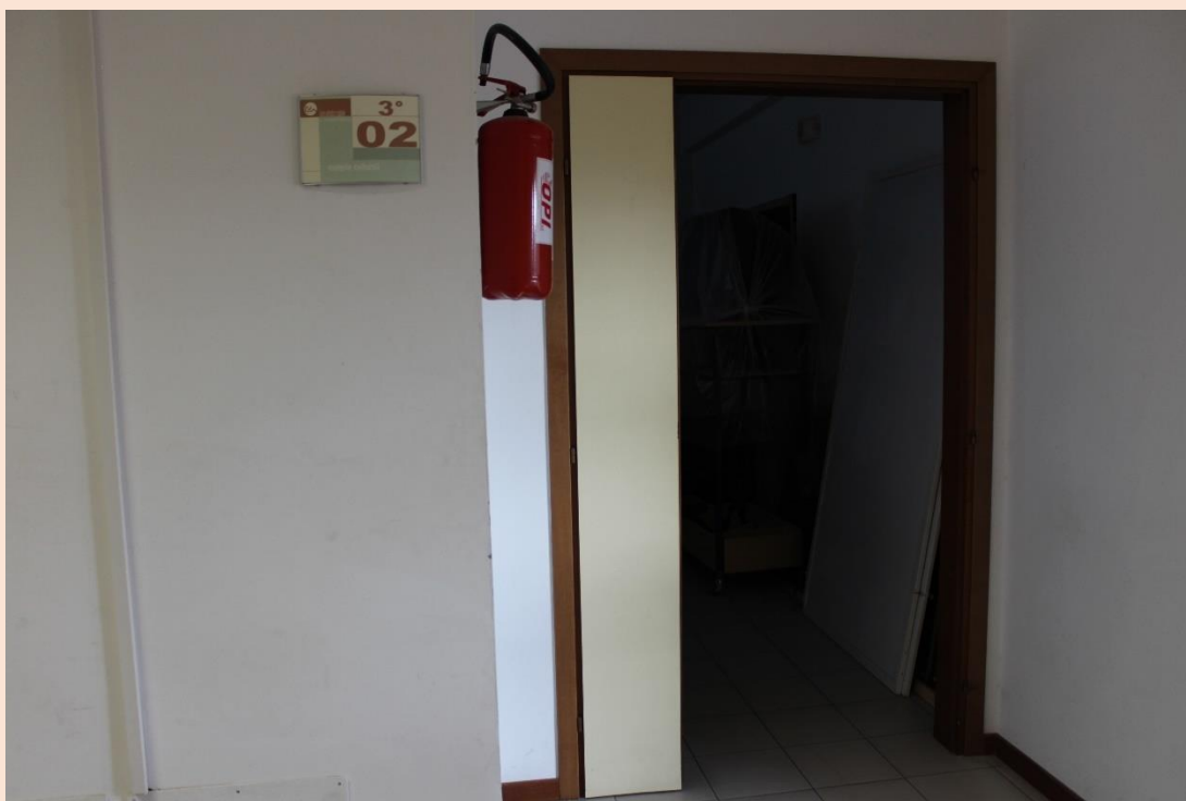
PIANO TERZO – Uscita laboratorio materie culturali.