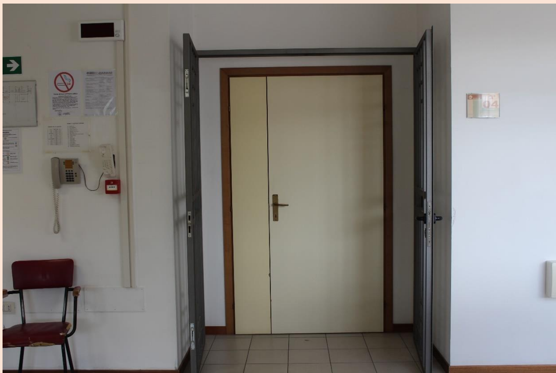
PIANO TERZO – Uscita laboratorio di informatica.