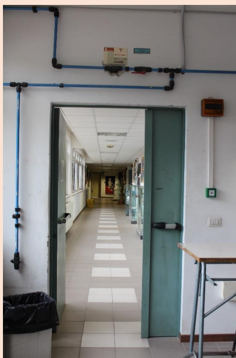
PIANO TERRA – Uscita laboratorio cesello.