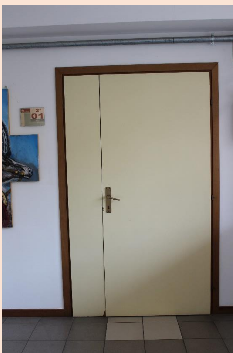
PIANO SECONDO – Uscita laboratorio figurativo.