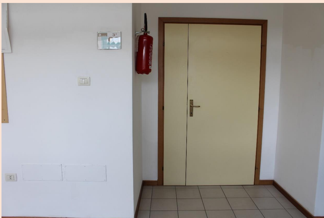
PIANO TERZO – Uscita laboratorio di informatica.