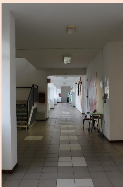
PIANO SECONDO – Corridoio.