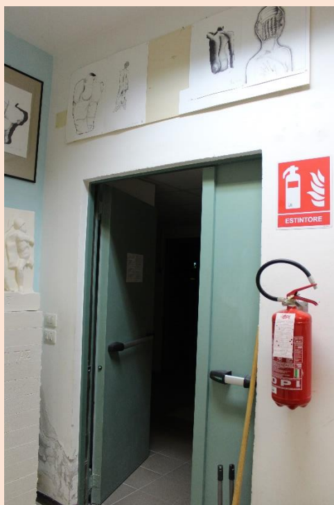
PIANO TERRA – Uscita aula plastica.