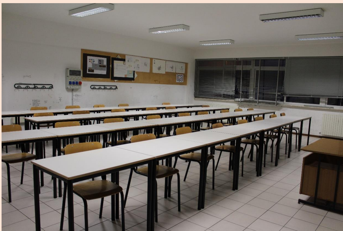
PIANO PRIMO – Laboratorio di progettazione arredamento.