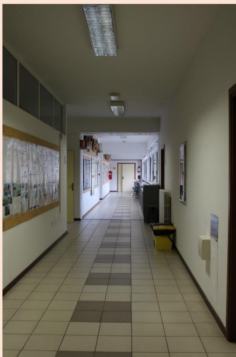
PIANO PRIMO – Corridoio.