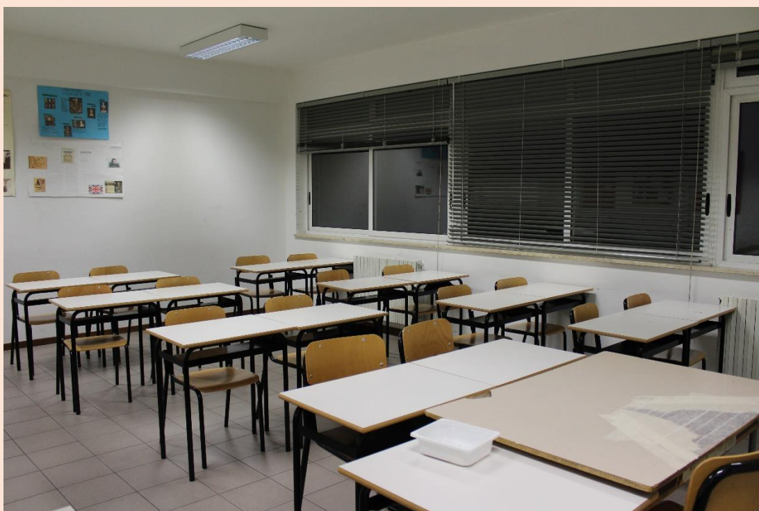
PIANO SECONDO – Aula.