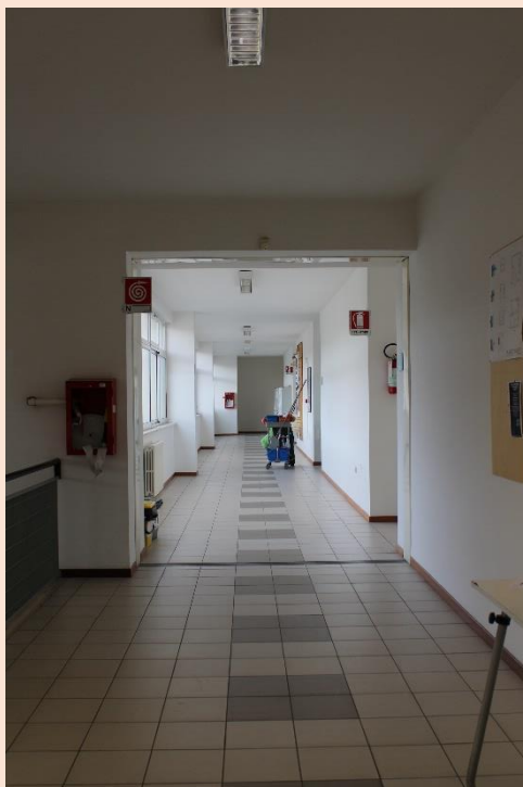
PIANO TERZO – Corridoio.