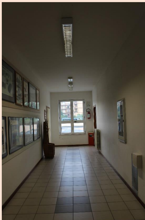
PIANO TERZO – Corridoio.