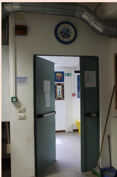
PIANO TERRA – Uscita laboratorio di oreficeria.