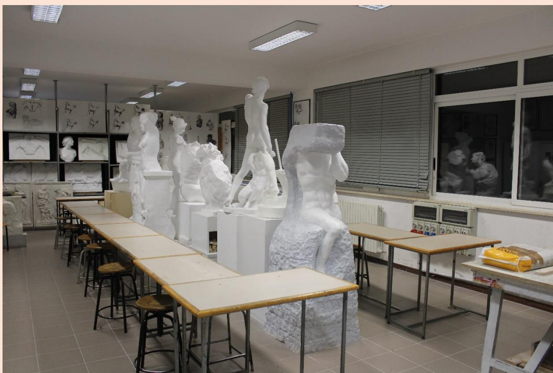
PIANO TERRA – Aula plastica.