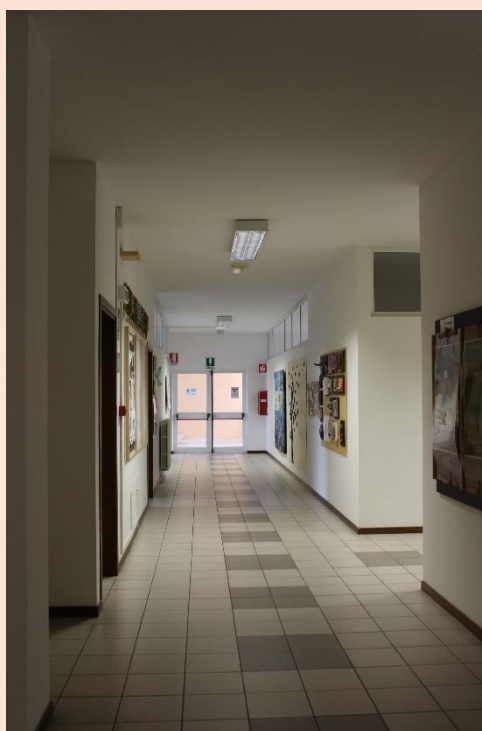
PIANO PRIMO – Corridoio.