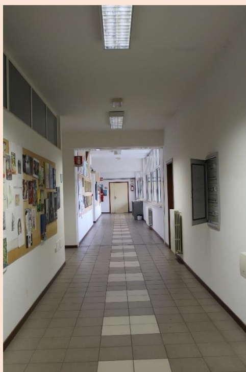
PIANO SECONDO – Corridoio.