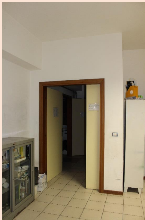
PIANO PRIMO – Uscita laboratorio di progettazione arredamento.