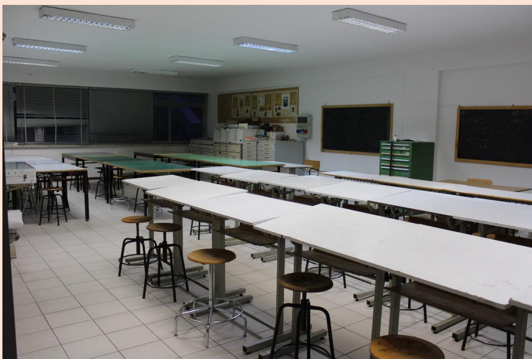
PIANO PRIMO – Laboratorio di architettura.