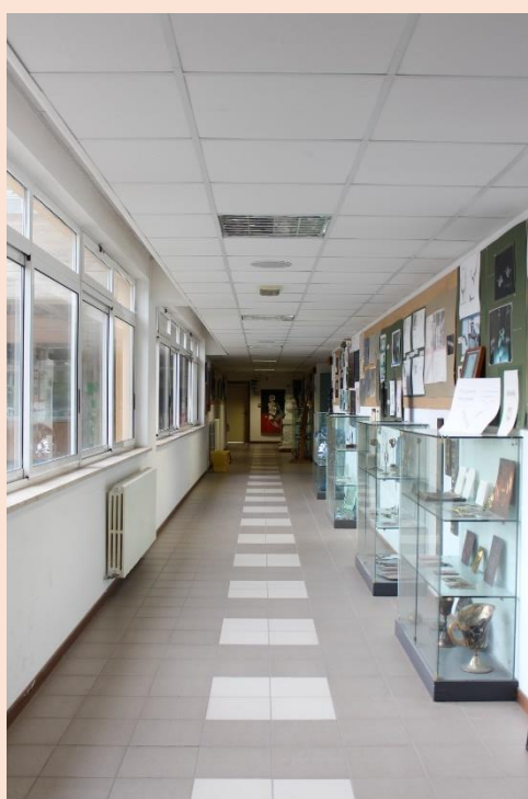
PIANO TERRA – Corridoio.