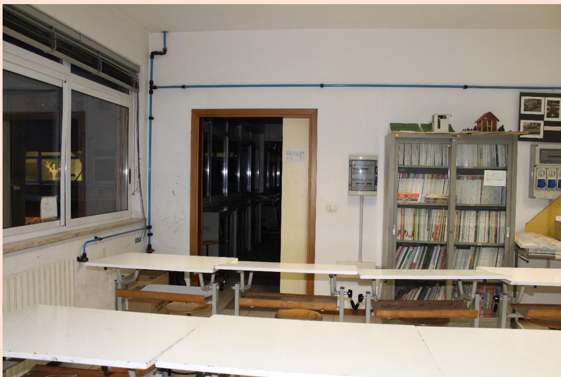
PIANO PRIMO – Uscita laboratorio di architettura.