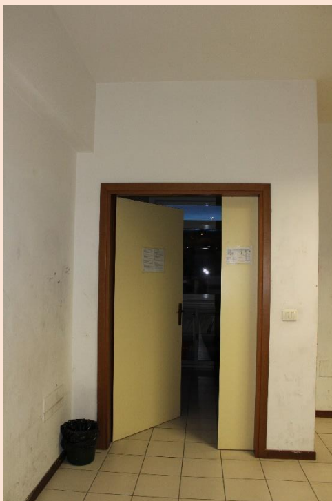
PIANO PRIMO – Uscita laboratorio di industrial design.