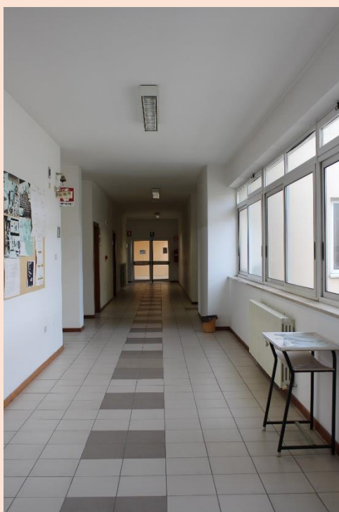
PIANO TERZO – Corridoio.