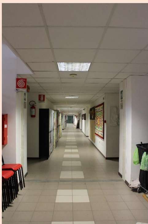
PIANO TERRA – Corridoio.