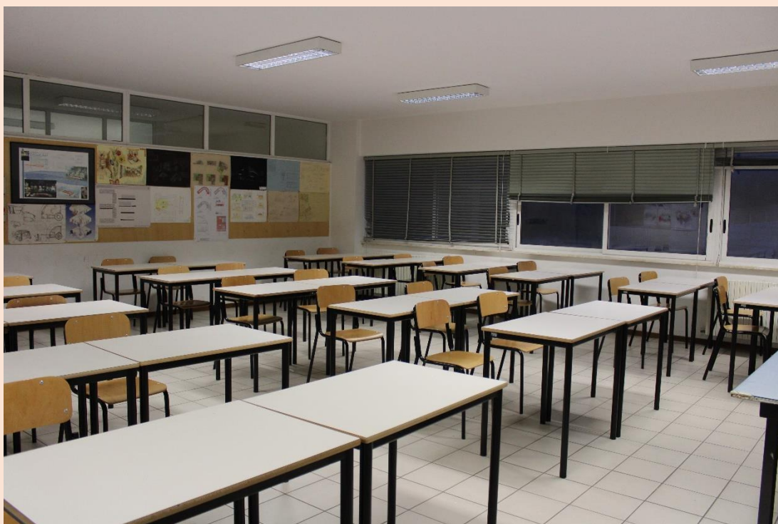
PIANO PRIMO – Laboratorio di disegno geometrico.