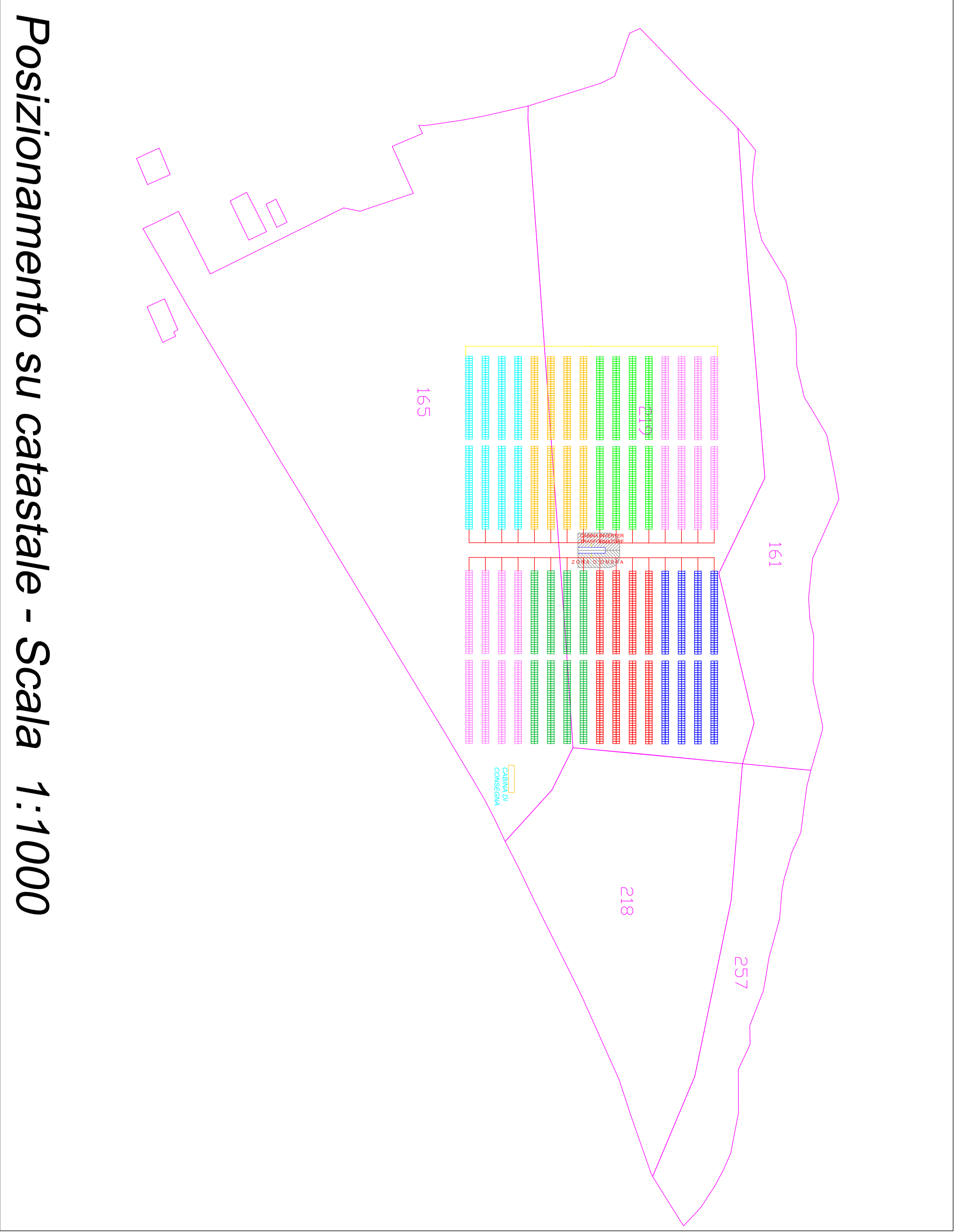
Posizionamento su catastale - Scala 1:1000