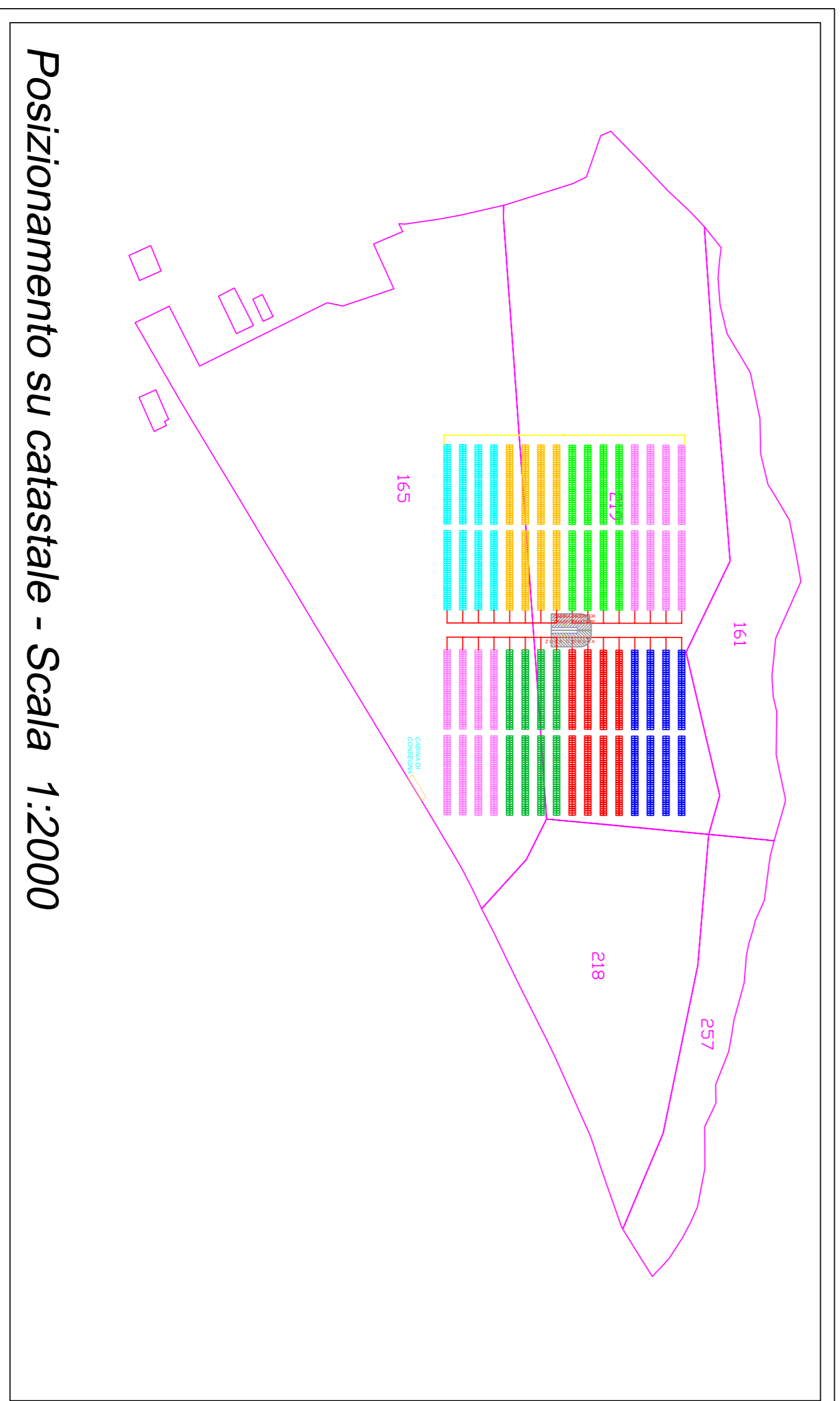
Posizionamento su catastale - Scala 1:2000