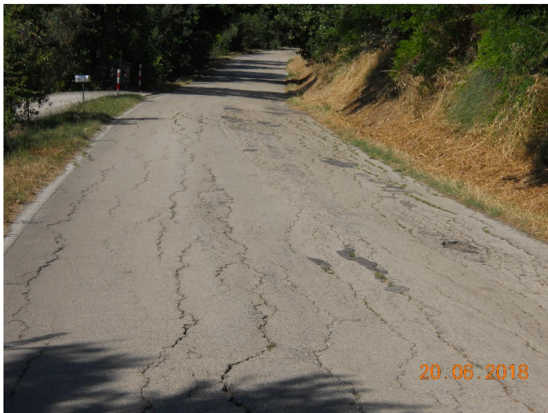
Foto 3. Km 4+101 - Avvallamento della pavimentazione stradale con fessure longitudinali diffuse.