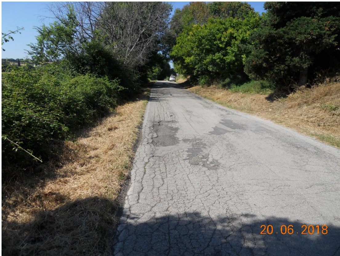
Foto 6. Km 6+001 - Avvallamenti della pavimentazione stradale, fessurazione a ragnatela dei bordi, deterioramento e distacco dei rappezzati con formazione di buche.