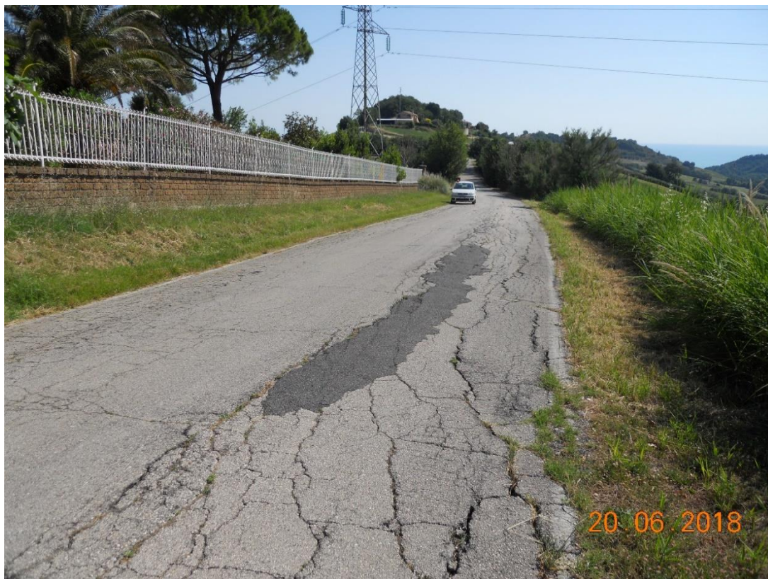
Foto 1. Km 3+800 - Avvallamento della pavimentazione stradale con fessurazione a blocchi della fascia centrale e fessurazione a ragnatela delle porzioni laterali.