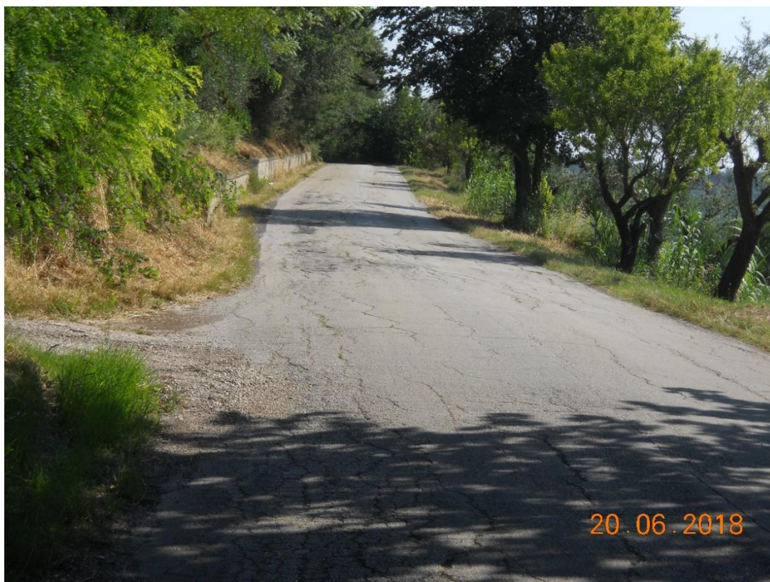
Foto 1. Km 4+100 - Avvallamento della pavimentazione stradale con fessure longitudinali diffuse.