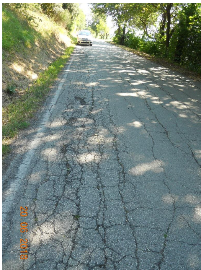
Foto 4. Km 4+102 - Fessurazione a ragnatela del bordo della pavimentazione stradale.